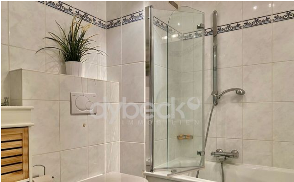
Badezimmer mit Duschwanne