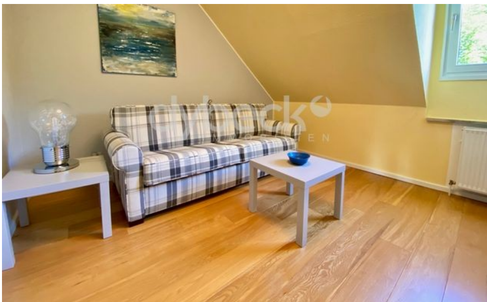
Zimmer 1. Ebene