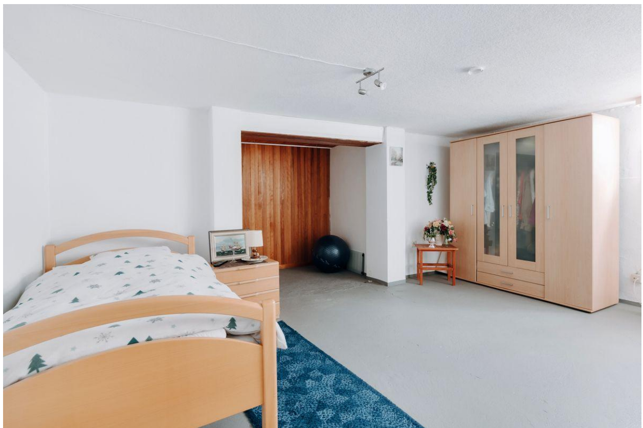
Wohnliches Zimmer im Keller